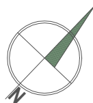
schemat rzutu III piętra